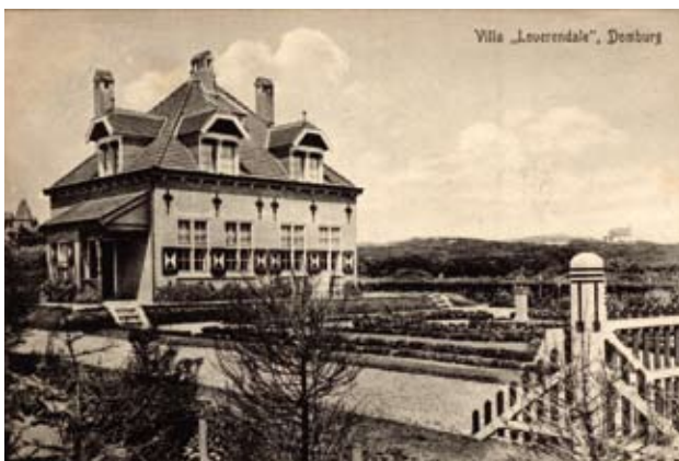
Villa Loverendale in Domburg.